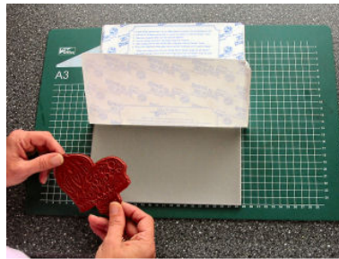
Vouw een stuk van het schutvel terug.