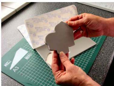
De achterzijde van de EZ mount...