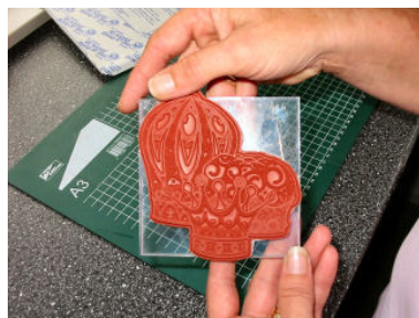
... kleeft op een acrylblok.