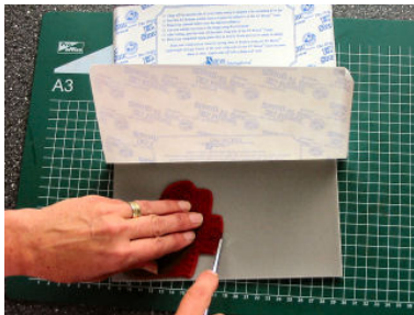
Snij met een scherp hobbymesje de stempel vlak langs de rand uit.