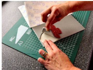
Trek voorzichtig de uitgesneden stempel los.