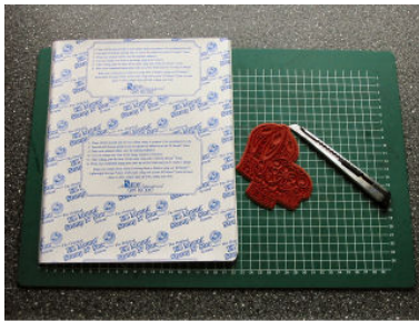
Nodig: EZ mount, stempel, hobbymesje.